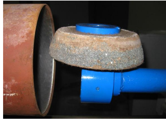
Рис. 2 – Схема внутреннего шлифования

В зависимости (2) отношение l/V_{дем} определяет время контакта шлифовального круга с обрабатываемой деталью: с его увеличением температура резания \theta уменьшается. Поэтому, очевидно, целесообразно шлифование производить с увеличенной длиной дуги контакта шлифовального круга с обрабатываемой деталью l . Эффективным решением в этом направлении является применение схемы внутреннего шлифования, в которой ось вращения шлифовального круга с индивидуальным приводом устанавливается перпендикулярно оси вращения обрабатываемого отверстия (рис. 2 [5]).